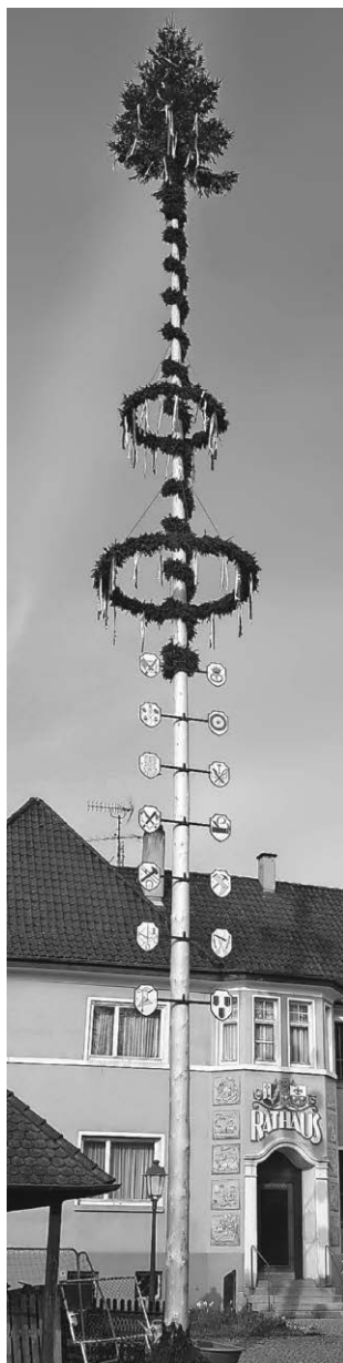
Der Maibaum in Gutenzell