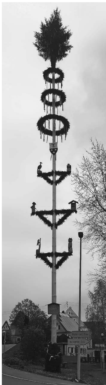
Der Maibaum in Hürbel

Sowohl in Gutenzell als auch in Hürbel schmücken seit Kurzem wieder traditionelle Maibäume das Ortsbild. Viele Helferinnen und Helfer waren im Einsatz und haben im Vorfeld den Baum entastet und geschält, Kränze gebunden, eine Krone erstellt sowie die aufwendig gestalteten Schilder und Figuren hergerichtet. Im Namen der Gemeinde Gutenzell-Hürbel herzlichen Dank an alle Beteiligten, die diese langjährige Tradition pflegen und aufrechterhalten.